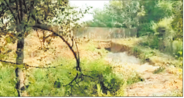
स्टाप डेम के तटबंध से निकलता पानी का सैलाब।

भारी मात्रा में पानी का सैलाब मिनी हाइडल प्लांट की ओर आने लगा। हाइडल प्लांट परिसर में पानी घुसने से प्लांट में कार्यरत कर्मचारियों में हड़कंप मच गया। आनन फानन में कर्मचारी अपनी जान बचाने प्लांट से बाहर निकल गए। हालांकि तब तक स्टाप डेम का पानी मिली हाइडल प्लांट व परिसर में एकत्र हो गया था। प्लांट में पानी घुसने से छोटी छोटी मशीनें पानी में डूब गई थी और प्लांट से विद्युत उत्पादन ठप पड़ गया था। जिसकी वजह से फिलहाल प्लांट को बंद कर दिया