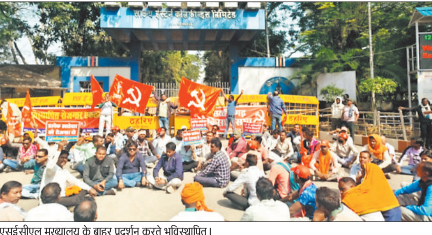
एसईसीएल मुख्यालय के बाहर प्रदर्शन करते भूविस्थापित।

हरिभूमि न्यूज >>> कोरबा एसईसीएल की खदानों से प्रभावित भूविस्थापितों ने छत्तीसगढ़ किसान सभा और भूविस्थापित रोजगार एकता संघ के नेतृत्व में रोजगार सहित अन्य मांगों को लेकर एसईसीएल मुख्यालय का घेराव कर दिया। धरना प्रदर्शन के दौरान