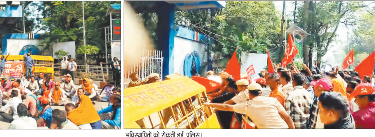
भूविस्थापितों को रोकती हुई पुलिस।

अन्य बोर्ड मंत्रियों ने प्रतिनिधि मंडल के साथ चर्चा की और जल्द बैठक आयोजित कर मांगों को पूरा करने का आश्वासन दिया, जिसके बाद भूविस्थापितों ने अपना घेराव प्रदर्शन समाप्त कर दिया। उल्लेखनीय है कि एसईसीएल के कुसमुंडा, गेवरा, दीपका, कोरबा क्षेत्र के प्रभावित गांव के भूविस्थापितों ने छत्तीसगढ़ किसान सभा और भूविस्थापित रोजगार एकता संघ के नेतृत्व में गुरुवार को अर्जन के बाद जन्म लेने वाले छोटे खातेदारों को रोजगार एवं लंबित रोजगार की प्रकरणों का निराकरण कर सभी खातेदारों को रोजगार देने, आउट सोर्सिंग कार्यों में प्रभावित गांव के बेरोजगारों को शत प्रतिशत रोजगार देने की मांग को लेकर रैली निकालते हुए एसईसीएल मुख्यालय के मुख्य द्वार को बंद कर घेराव प्रदर्शन शुरू कर दिया। इस दौरान एसईसीएल प्रबंधन द्वारा प्रभावितों की समस्याओं को गंभीरता से नहीं लेने पर प्रदर्शनकारी उग्र हो गए और रोजगार देने की मांग को लेकर नारेबाजी करने लगे। घेराव