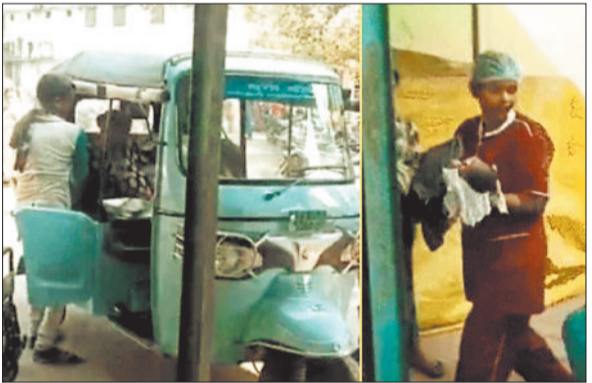
वह ऑटो जिसमें प्रसूता ने नवजात बच्चे को दिया जन्म।

दरद से तड़ प्रसूता को परिजन ई रिक्शा से लेकर अस्पताल के लिए रवाना हुए। इस दौरान प्रसूता के साथ स्वास्थ्य केन्द्र पहुंची मितानिन