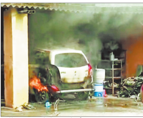
वह गैरेज जहां मरम्मत के दौरान कार में लगी आग।

एक ऑटो गैरेज में चल रही कार की मरम्मत के दौरान अचानक आग लग गई। पेट्रोल लीकेज की वजह से कार में आग भड़क उठी। हालांकि किसी तरह की जनहानि नहीं हुई, लेकिन कार पूरी तरह से