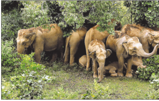
जंगल में विचरण करता हाथियों का झुंड।

खास बात करतला रेंज में सबसे ज्यादा हाथियों का झुंड, करतला में ही ट्रैक्टर का हों रहा इस्तेमाल