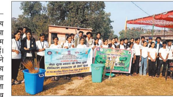
कार्यक्रम में उपस्थित छात्र छात्राएं।