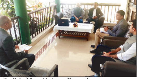
अधिकारियों की बैठक लेते संयुक्त सचिव व कलेक्टर।

संयुक्त सचिव कृषि एवं किसान कल्याण मंत्रालय पी अंबलनगन द्वारा गुरुवार की को दोपहर 1.30 बजे नवीन प्रधानमंत्री धन धान्य कृषि योजना अंतर्गत चर्चानित कोरबा जिला के कृषि एवं संबद्ध विभागों की संयुक्त समीक्षा की गई। समीक्षा में जिला कृषि एवं संबद्ध विकास कार्ययोजना, आधारभूत सर्वेक्षण और चिंतन शिविर के बारे में विस्तृत चर्चा किया गया। जिले में कृषि एवं संबद्ध क्षेत्र की वर्तमान स्थिति, चुनौतियां और संभावनाओं के बारे में विभागों से चर्चा किया गया। योजनांतर्गत दिए 6 लक्ष्यों अंतर्गत फसल उत्पादकता बढ़ाने, फसल विविधीकरण में वृद्धि, फसल कटाई उपरांत प्रबंधन, सिंचाई सुविधाओं का विस्तार, कृषि ऋण सुविधा को सुलभ बनाने के संभावनाओं पर चर्चा किया गया।