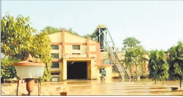
मिनी हाइडल प्लांट में घुसा पानी।

छत्तीसगढ़ राज्य विद्युत उत्पादन कंपनी के 1340 मेगावाट विद्युत उत्पादन क्षमता वाले कोरबा पश्चिम संयंत्र परिसर के समीप मिनी हाइडल प्लांट का संचालन किया जाता है। इस हाइडल प्लांट में 850 किलोवाट की दो इकाईयों से विद्युत